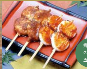
郷土食 の筆頭 五平餅