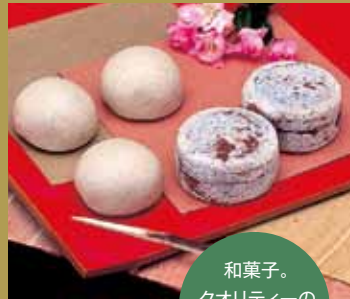
和菓子。 クオリティーの高さは長野県一