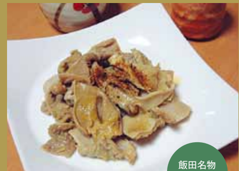
飯田名物 おたぐり