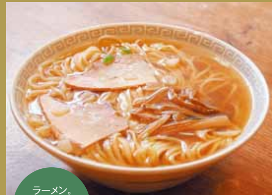
ラーメン。 麺が少し伸びた 感じが飯田風