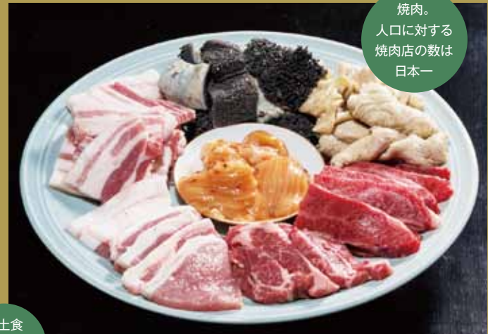
焼肉。 人口に対する 焼肉店の数は 日本一